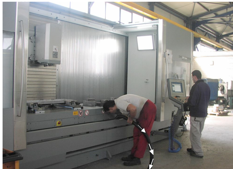
Καθαρισμός μεγάλου μηχανήματος CNC με υψηλό κενό

Τα καπναέρια των Ηλεκτροσυγκολλήσεων απορροφώνται με αποτελεσματικό τρόπο από τους Βραχίονες Απαγωγής NEDERMAN πριν διαχυθούν και καταλάβουν όλο τον χώρο. Η ζώνη αναπνοής του Ηλεκτροσυγκολλητή διατηρείται καθαρή. Η σκόνη τα σταγονίδια και οι αναθυμιάσεις από τις άλλες κατεργασίες απάγονται επίσης από τους βραχίονες