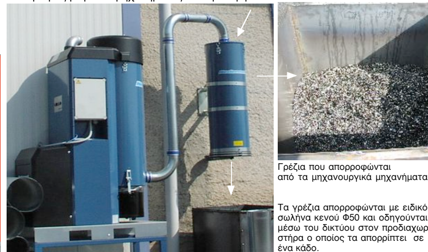
Γρέζια που απορροφώνται από τα μηχανουργικά μηχανήματα.

Τα γρέζια απορροφώνται με ειδικό σωλήνα κενού Φ50 και οδηγούνται μέσω του δικτύου στον προδιαχωριστήρα ο οποίος τα απορρίπτει σε ένα κάδο.