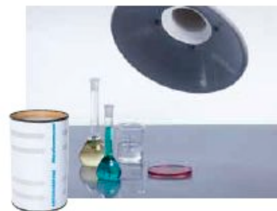
Στοιχείο ενεργού άνθρακα για αέρια-οσμές

Στοιχείο για πολύ λεπτά σωματίδια. Απόδοση μέχρι 99.95% στα 0.2μm. Μπορεί να συνδυασθεί με άλλα στοιχεία σωματιδίων ή ενεργού άνθρακα για πληρέστερο καθαρισμό.