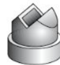
Ακροστόμιο για εξωτερικές γωνιές