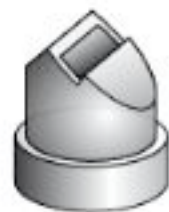
Ακροστόμιο για άκρες