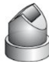
Ακροστόμιο για εσωτερικές γωνιές