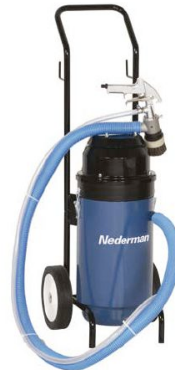
Nederman SB 750