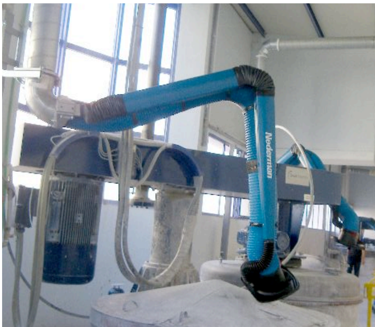
Βραχίονες HD σε εφαρμογή απαγωγής σκόνης στην Χρωματοβιομηχανία H.B.BODY στην Θεσσαλονίκη