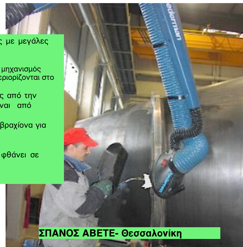
ΣΠΑΝΟΣ ΑΒΕΤΕ- Θεσσαλονίκη

Είναι κατασκευασμένος για βαρείες εφαρμογές με μεγάλες εκπομπές σκόνης ή καπναερίων Η διάμετρος του αεραγωγού είναι Φ1600mm και ο μηχανισμός αυτοστήριξης είναι εξωτερικός, έτσι οι απώλειες περιορίζονται στο ελάχιστο. Η απορρόφηση του βραχίονα εξαρτάται βεβαίως από την ικανότητα του απορροφητήρα και μπορεί να είναι από 1000 έως 1300m 3 /h. Ο αεραγωγός αποσπάται πολύ εύκολα από τον βραχίονα για καθαρισμό. Διατίθεται σε μήκη 2,0-3,0-4,0 και 5,0m Εαν χρησιμοποιηθεί με την ειδική προέκταση φθάνει σε ακτίνα δράσης 9.30m.