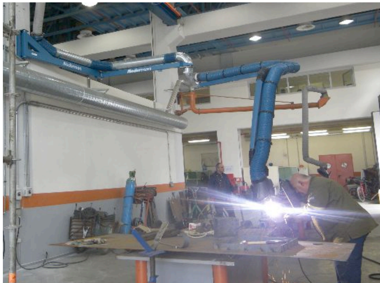
Βραχίονες MD σε εφαρμογή απαγωγής καπναερίων Ηλεκτροσυγκόλλησης στα ΕΛΛΗΝΙΚΑ ΠΕΤΡΕΛΑΙΑ ΑΕ στον Ασπρόπυργο