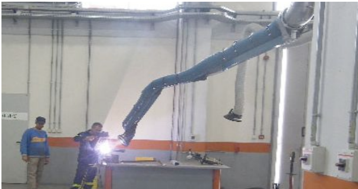
Βραχίονες MD σε εφαρμογή απαγωγής καπναερίων Ηλεκτροσυγκόλλησης στα ΕΛΛΗΝΙΚΑ ΠΕΤΡΕΛΑΙΑ ΑΕ στον Ασπρόπυργο