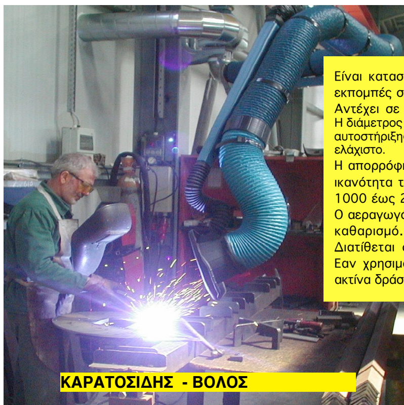
ΚΑΡΑΤΟΣΙΔΗΣ - ΒΟΛΟΣ