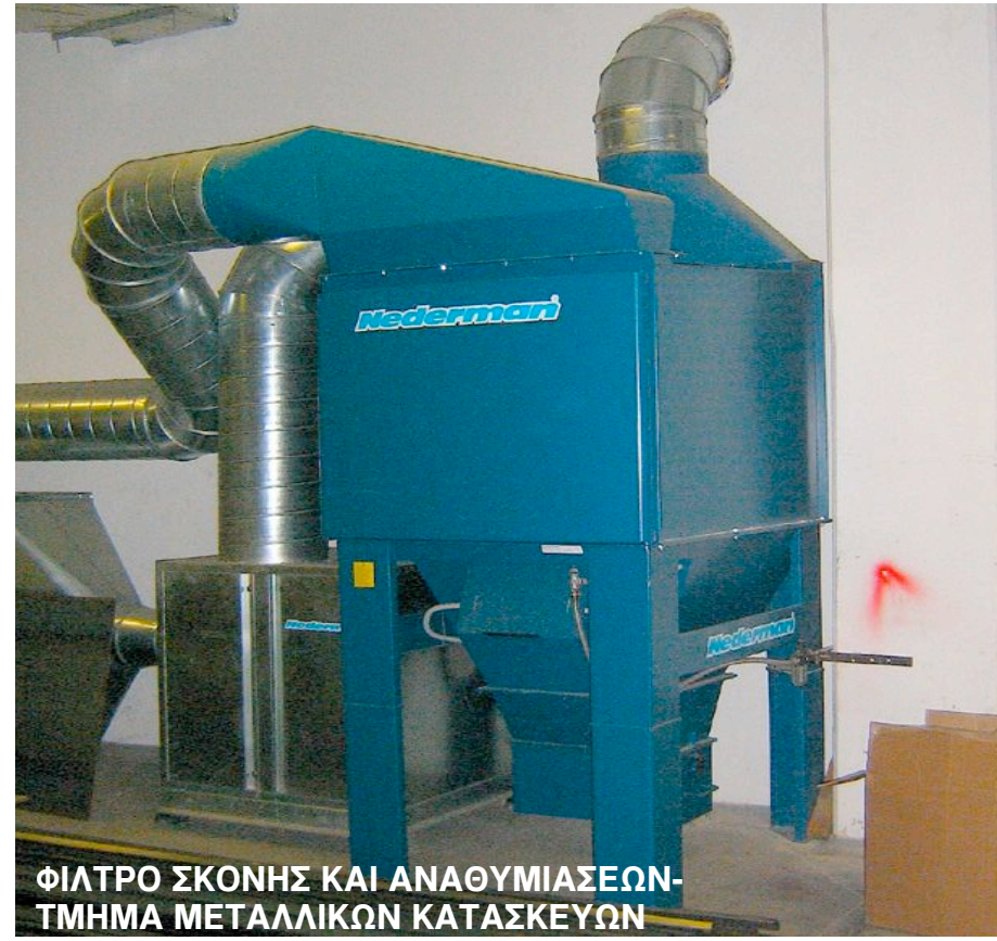
ΦΙΛΤΡΟ ΣΚΟΝΗΣ ΚΑΙ ΑΝΑΘΥΜΙΑΣΕΩΝ-ΤΜΗΜΑ ΜΕΤΑΛΛΙΚΩΝ ΚΑΤΑΣΚΕΥΩΝ