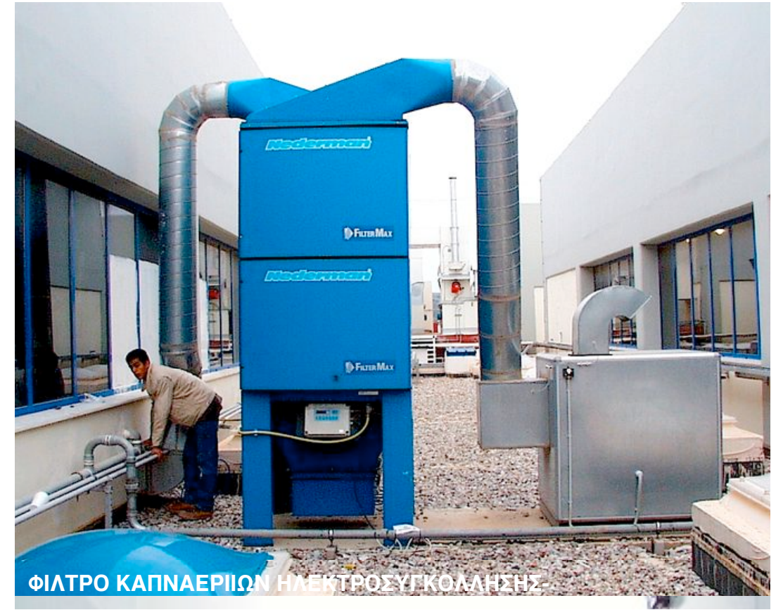
ΦΙΛΤΡΟ ΚΑΠΝΑΕΡΙΩΝ ΗΛΕΚΤΡΟΣΥΓΚΟΛΗΣΗΣ