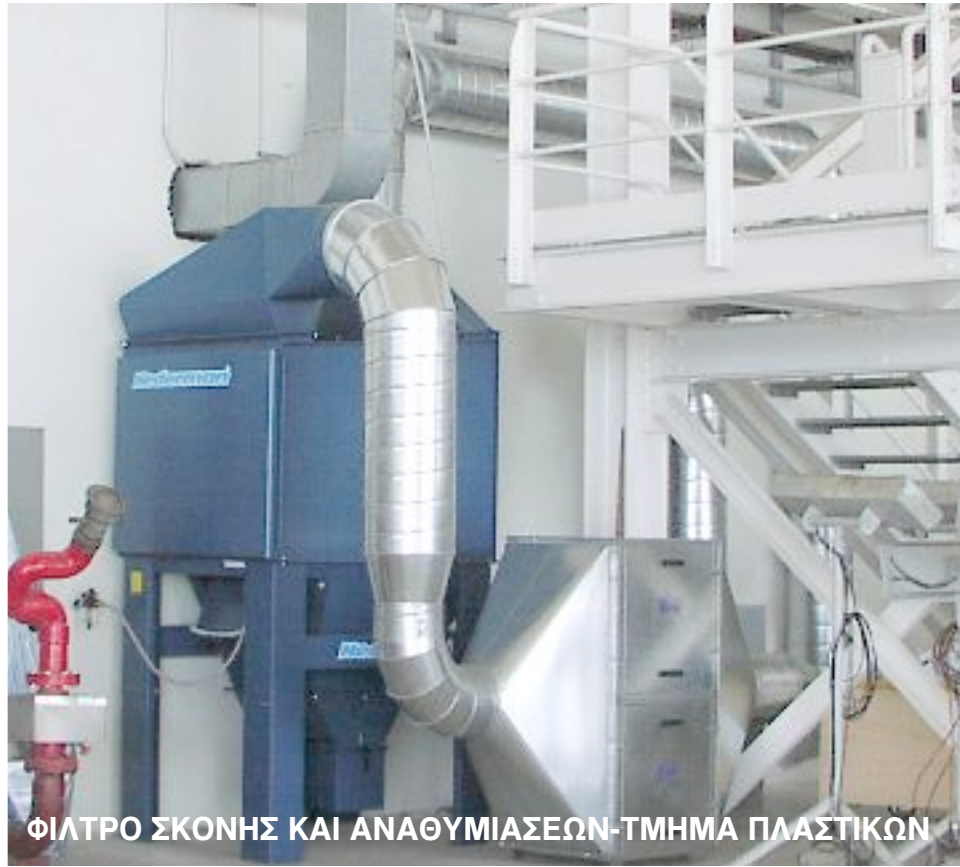
ΦΙΛΤΡΟ ΣΚΟΝΗΣ ΚΑΙ ΑΝΑΘΥΜΙΑΣΕΩΝ-ΤΜΗΜΑ ΠΛΑΣΤΙΚΩΝ