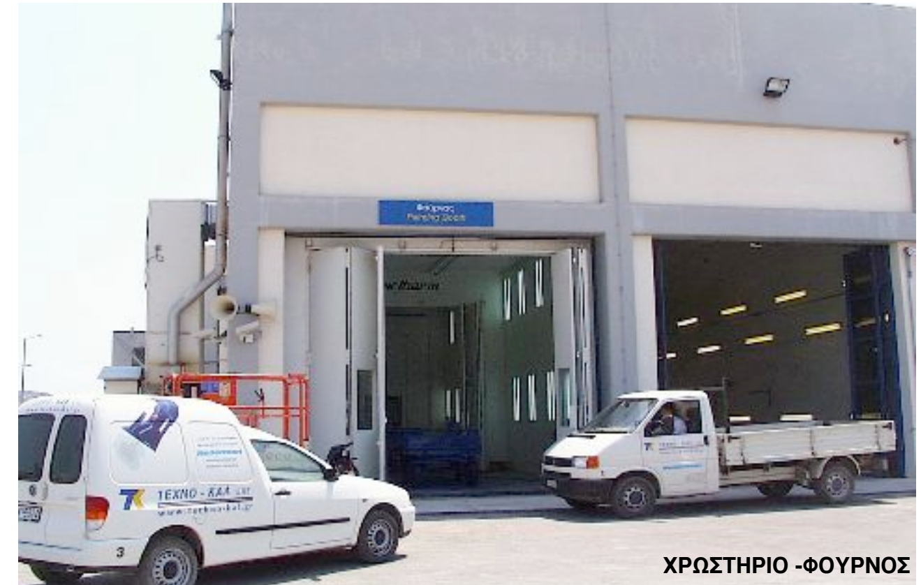
ΧΡΩΣΤΗΡΙΟ - ΦΟΥΡΝΟΣ