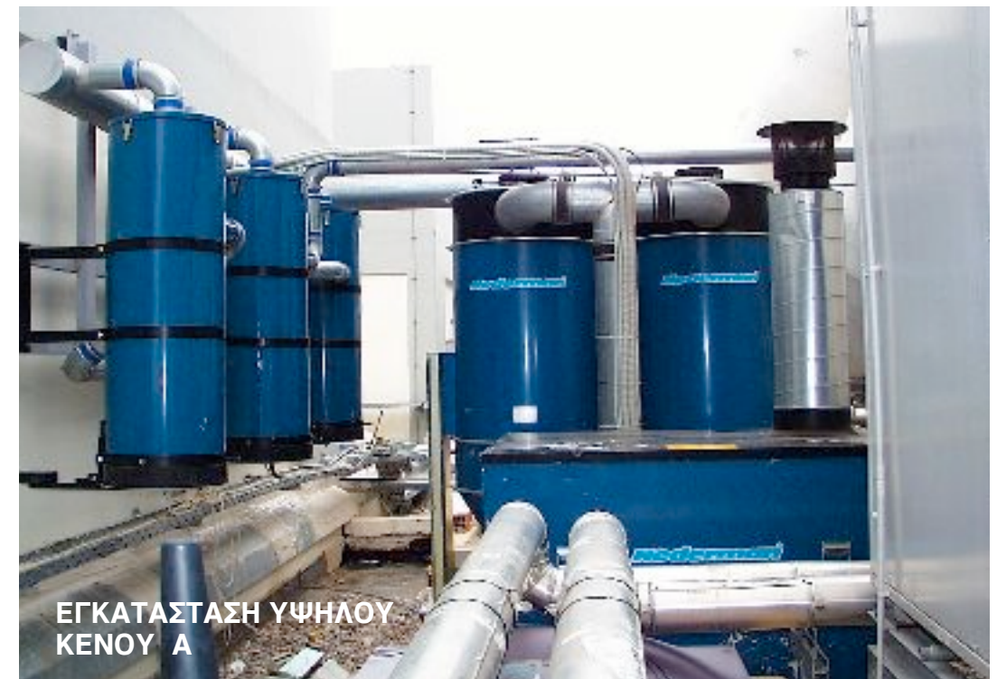
ΕΓΚΑΤΑΣΤΑΣΗ ΥΨΗΛΟΥ ΚΕΝΟΥ Α