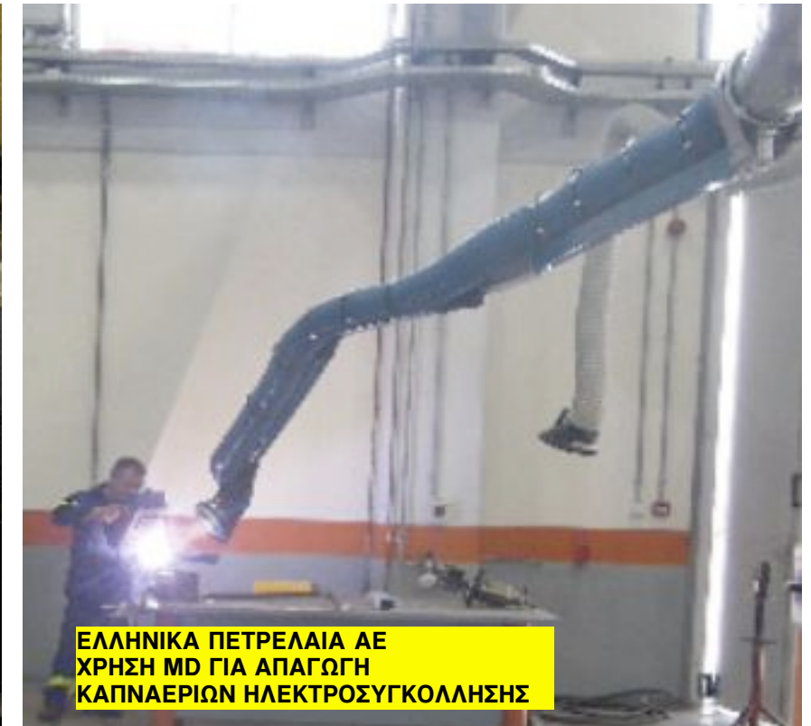
ΕΛΛΗΝΙΚΑ ΠΕΤΡΕΛΑΙΑ ΑΕ ΧΡΗΣΗ MD ΓΙΑ ΑΠΑΓΩΓΗ ΚΑΠΝΑΕΡΙΩΝ ΗΛΕΚΤΡΟΣΥΓΚΟΛΛΗΣΗΣ