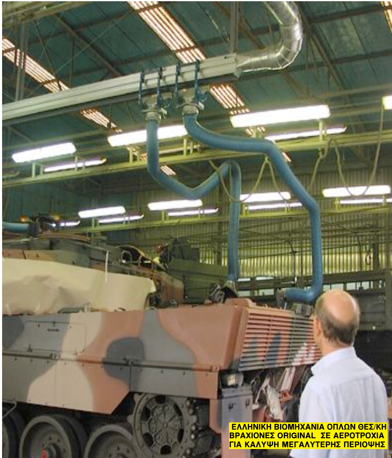
ΕΛΛΗΝΙΚΗ ΒΙΟΜΗΧΑΝΙΑ ΟΠΛΩΝ ΘΕΣ/ΚΗ ΒΡΑΧΙΟΝΕΣ ORIGINAL ΣΕ ΑΕΡΟΤΡΟΧΙΑ ΓΙΑ ΚΑΛΥΨΗ ΜΕΓΑΛΥΤΕΡΗΣ ΠΕΡΙΟΨΗΣ