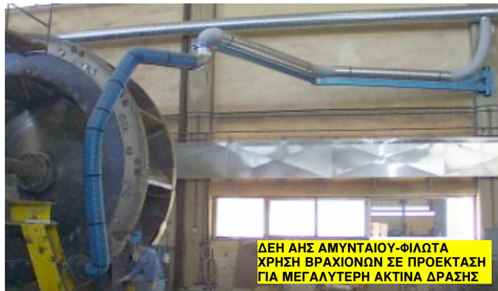
ΔΕΗ ΑΗΣ ΑΜΥΝΤΑΙΟΥ-ΦΙΛΩΤΑ ΧΡΗΣΗ ΒΡΑΧΙΟΝΩΝ ΣΕ ΠΡΟΕΚΤΑΣΗ ΓΙΑ ΜΕΓΑΛΥΤΕΡΗ ΑΚΤΙΝΑ ΔΡΑΣΗΣ