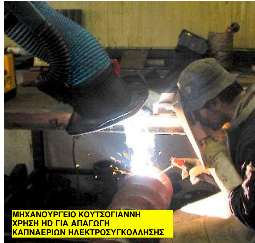
ΜΗΧΑΝΟΥΡΓΕΙΟ ΚΟΥΤΣΟΓΙΑΝΝΗ ΧΡΗΣΗ HD ΓΙΑ ΑΠΑΓΩΓΗ ΚΑΠΝΑΕΡΙΩΝ ΗΛΕΚΤΡΟΣΥΓΚΟΛΛΗΣΗΣ