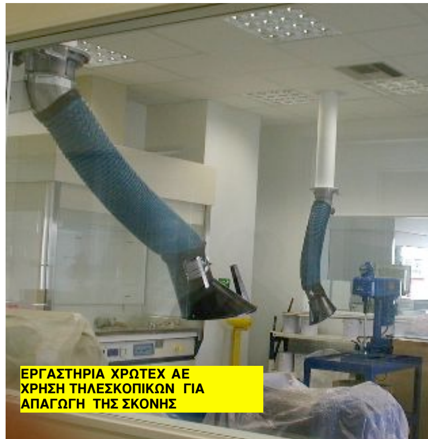
ΕΡΓΑΣΤΗΡΙΑ ΧΡΩΤΕΧ ΑΕ ΧΡΗΣΗ ΤΗΛΕΣΚΟΠΙΚΩΝ ΓΙΑ ΑΠΑΓΩΓΗ ΤΗΣ ΣΚΟΝΗΣ