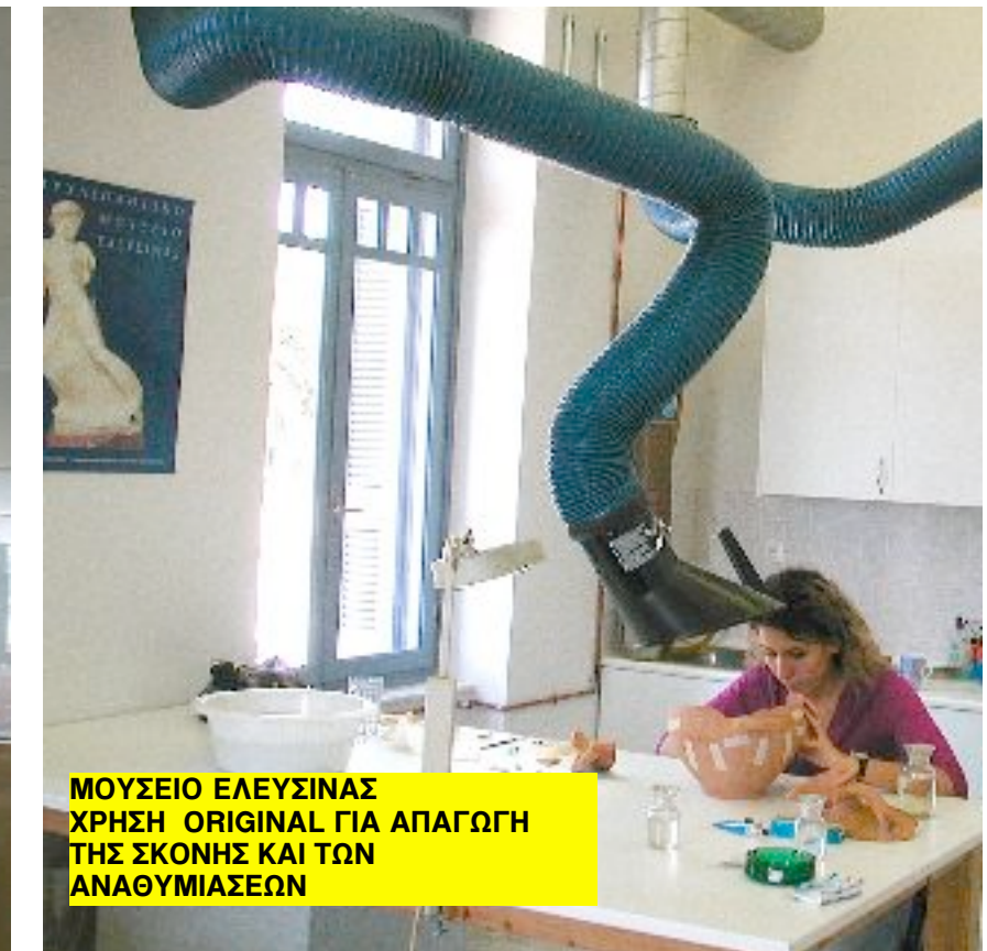
ΜΟΥΣΕΙΟ ΕΛΕΥΣΙΝΑΣ ΧΡΗΣΗ ORIGINAL ΓΙΑ ΑΠΑΓΩΓΗ ΤΗΣ ΣΚΟΝΗΣ ΚΑΙ ΤΩΝ ΑΝΑΘΥΜΙΑΣΕΩΝ