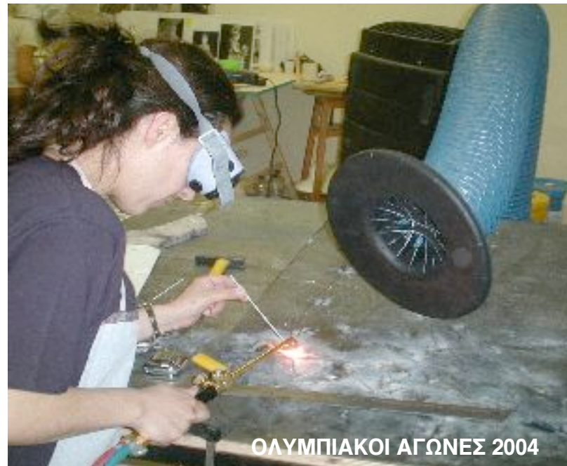
ΟΛΥΜΠΙΑΚΟΙ ΑΓΩΝΕΣ 2004