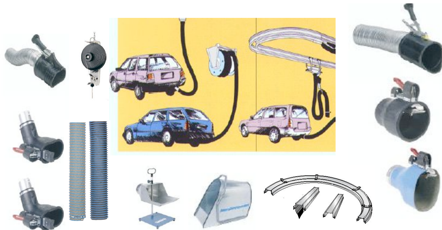
ΕΛΑΣΤΙΚΟΣΩΛΗΝΕΣ ΑΠΑΓΩΓΗΣ ΚΑΥΣΑΕΡΙΩΝ - ΑΚΡΟΣΤΟΜΙΑ - ΡΑΓΙΕΣ - ΑΠΟΡΡΟΦΗΤΗΡΕΣ

ΕΞΟΠΛΙΣΜΟΙ ΣΤΑΘΜΩΝ ΤΕΧΝΙΚΟΥ ΕΛΕΓΧΟΥ ΟΧΗΜΑΤΩΝ