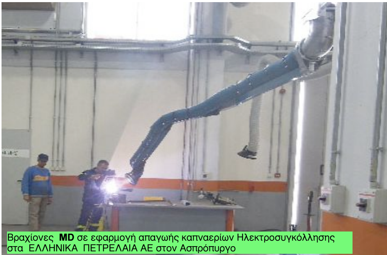
Βραχίονες MD σε εφαρμογή απαγωγής καπναερίων Ηλεκτροσυγκόλλησης στα ΕΛΛΗΝΙΚΑ ΠΕΤΡΕΛΑΙΑ ΑΕ στον Ασπρόπυργο