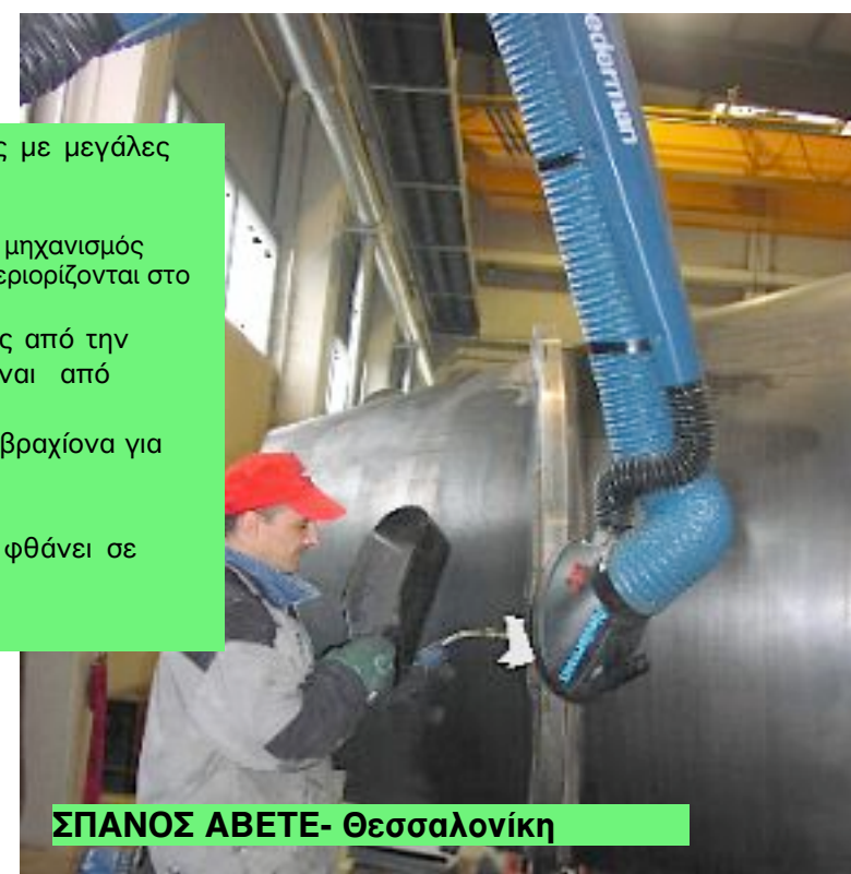
ΣΠΑΝΟΣ ΑΒΕΤΕ- Θεσσαλονίκη

Είναι κατασκευασμένος για βαρείες εφαρμογές με μεγάλες εκπομπές σκόνης ή καπναερίων Η διάμετρος του αεραγωγού είναι Φ1600mm και ο μηχανισμός αυτοστήριξης είναι εξωτερικός, έτσι οι απώλειες περιορίζονται στο ελάχιστο. Η απορρόφηση του βραχίονα εξαρτάται βεβαίως από την ικανότητα του απορροφητήρα και μπορεί να είναι από 1000 έως 1300m 3 /h. Ο αεραγωγός αποσπάται πολύ εύκολα από τον βραχίονα για καθαρισμό. Διατίθεται σε μήκη 2,0-3,0-4,0 και 5,0m Εάν χρησιμοποιηθεί με την ειδική προέκταση φθάνει σε ακτίνα δράσης 9.30m.