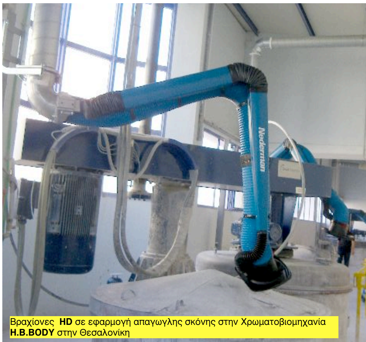
Βραχίονες HD σε εφαρμογή απαγωγής σκόνης στην Χρωματοβιομηχανία H.B.BODY στην Θεσσαλονίκη