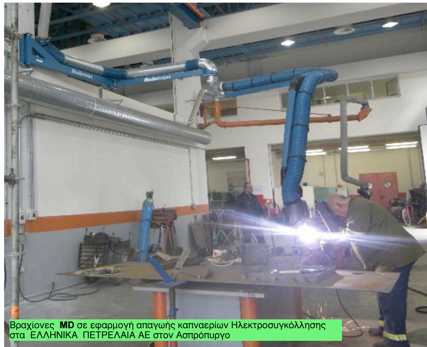
Βραχίονες MD σε εφαρμογή απαγωγής καπναερίων Ηλεκτροσυγκόλλησης στα ΕΛΛΗΝΙΚΑ ΠΕΤΡΕΛΑΙΑ ΑΕ στον Ασπρόπυργο